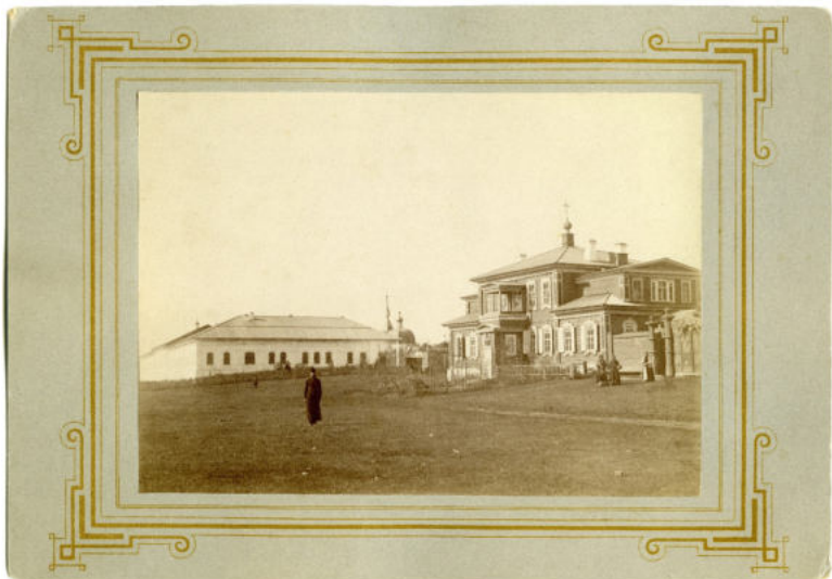
КККМ о/ф 10275-30 — Фотография. Успенский мужской монастырь и домовая церковь. 1890-е гг.