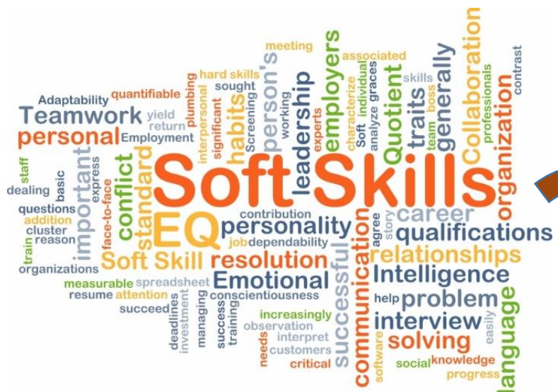
Рисунок 1. Востребованные гибкие навыки педагога